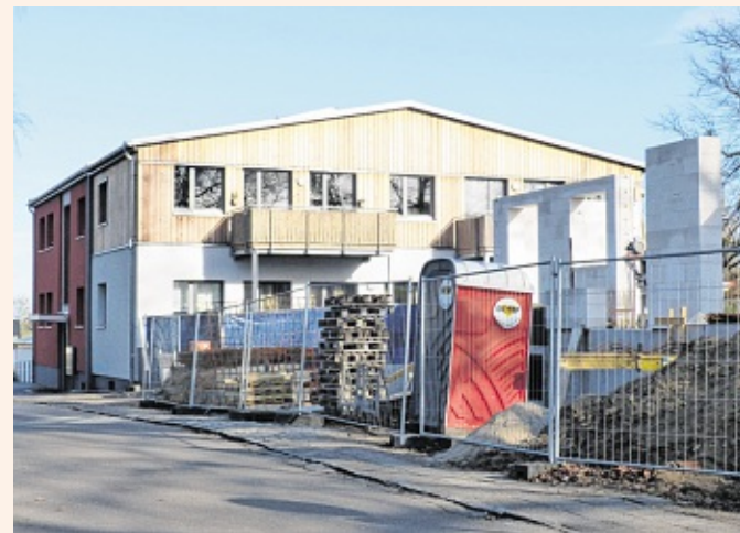
Die gleiche Stelle in der Schlossgartenallee im Februar 2019.

Nach 1945 wurde das Ausflugslokal durch das Sowjetische Militär beschlagnahmt und als Klubhaus genutzt. 1950 erfolgte die Rückgabe mit großen Gebäudeschäden. Deshalb erfolgte der Abriss von Teilen der Gebäude. 1956 übernahm die Betriebs-sportgemeinschaft „Einheit“ Teile der Anlage, eine Gaststätte entstand. Heute ist der Sportverein Einheit mit seinem breiten Sportangebot